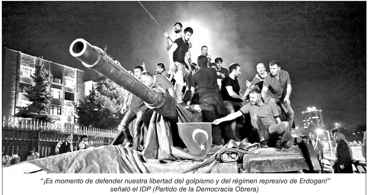
"¡Es momento de defender nuestra libertad del golpismo y del régimen represivo de Erdogan!" señaló el IDP (Partido de la Democracia Obrera)

2• El golpe no fue exitoso porque la junta convocante no logró volcar más fuerzas del ejército ni adhesión popular. Tampoco tuvo apoyo de los Estados Unidos ni del imperialismo europeo (UE), quienes se demoraron en pronunciarse categóricamente en contra, generando choques con el régimen. El imperialismo desconfía de la capacidad política de Erdogan para mantener una estabilidad política en un país estratégico en Medio Oriente. Por otro lado, la mayor parte de la burguesía turca y sus partidos tampoco lo apoyaron pese a los roces existentes. Viendo las imágenes daba la impresión que el golpe fue derrotado por una movilización popular, pero la realidad fue más contradictoria. El odio de los trabajadores, la juventud y el pueblo kurdo al régimen de Erdogan hizo imposible que esos sectores salieran a la calles. Aquellos que sí salieron son la base y el aparato del partido de Erdogan, el AKP (Partido de la Justicia y el Desarrollo), quienes acudieron a su llamado. A dichas acciones se sumaron policías y sectores de los servicios del estado. Conforman una base bastante conservadora y reaccionaria: gritaban por Alá y pedían condenas a