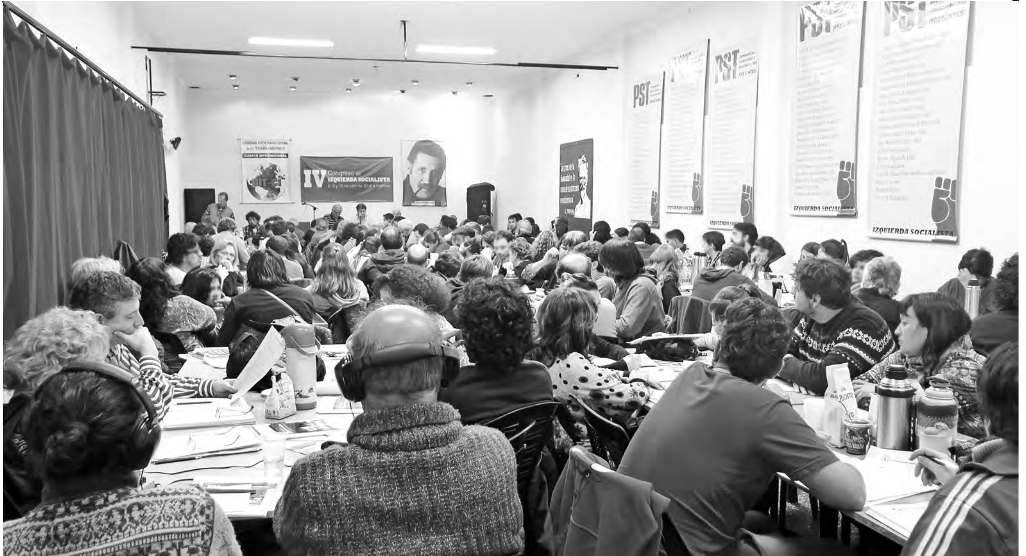
Vista de la sesión del Congreso

escuchar a los nuevos compañeros quienes por primera vez participaban de un congreso de nuestro partido, entre ellos los invitados, algunos provenientes de otras experiencias de izquierda que se han sumado reciente a nuestra organización.