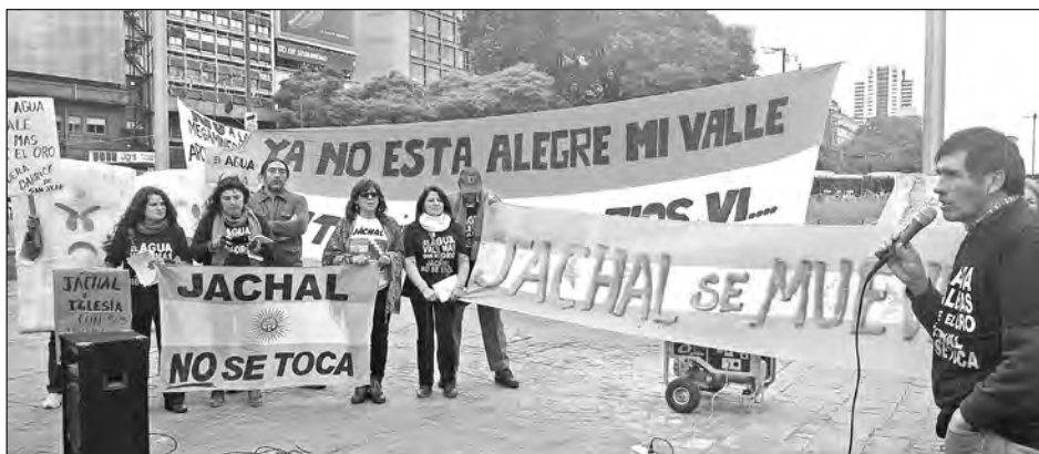
Asambleístas sanjuaninos en Buenos Aires

tonces. La repetimos obsesivamente durante el kirchnerismo, mientras nos vendían que “nos estábamos desendeudando”. Y lo volvemos a decir ahora con Macri. Más que nunca, la única salida es dejar ya mismo de pagar la ilegal, inmoral, fraudulenta e impagable deuda externa, y poner todos esos recursos para resolver las urgentes necesidades populares de salario, trabajo, salud, educación y vivienda.