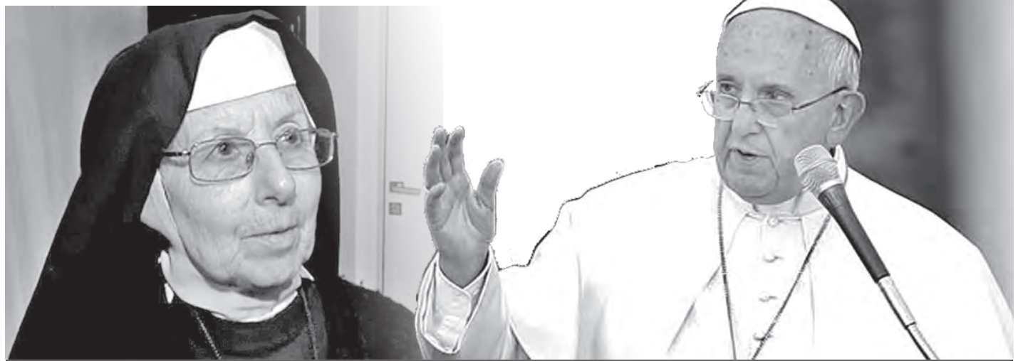
Se siguen revelando los negocios corruptos entre la Iglesia y los gobiernos patronales