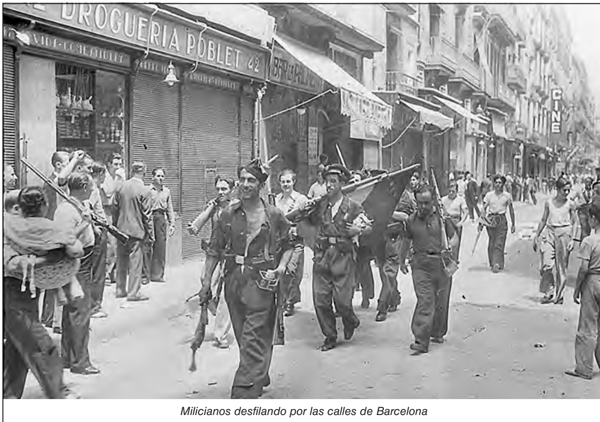
Milicianos desfilando por las calles de Barcelona

El gobierno del Frente Popular intentaba conciliar los irreconciliables intereses de las clases en lucha, sin lograrlo. El enfrentamiento se fue agudizando día a día con oleadas de huelgas y ocupaciones de tierras. La derecha fascista y monárquica conspiraba junto a un sector de las fuerzas armadas encabezado por el general Francisco Franco.