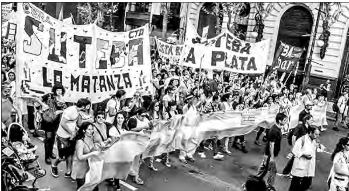
Nuevo paro docente contra la gobernadora Vidal

El gobierno nacional reconoce que la inflación anual pasará el 40%. La burocracia sindical del Frente Gremial Docente (FGD) de Suteba, FEB y Udocba firmaron un acuerdo del 23% en tres partes hasta marzo de 2017. Los Suteba combativos llaman a parar 48 horas el 1 y 2 de agosto como inicio de un plan de lucha.