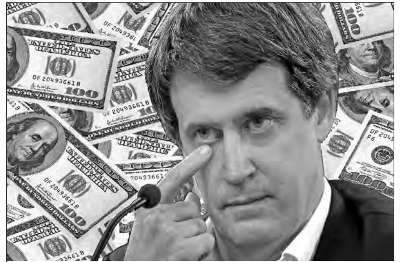
Se acaban de pagar 3952 millones de dólares con reservas

Por supuesto, como pasa siempre, toda esa “lluvia de dólares” no entra a ningún circuito productivo. Una masa importante “entró y salió”, no quedando nada en el país. Así fue con los 9.000 millones de dólares de pago al contado a los buitres, o con los más de 6.000 millones de dólares que salieron en concepto de “remisión de utilidades” de las transnacionales a sus casas matrices. Otra parte alimentó directamente la fuga de capitales (3.500 millones) y el resto quedó en el país, pero “jugando” en la bicicleta financiera, donde se obtenían ganancias de hasta el 38% anual comprando las ya citadas Lebacs. En síntesis, la nueva deuda bancó a los pulpos financieros y sus negociados y nos quedó como