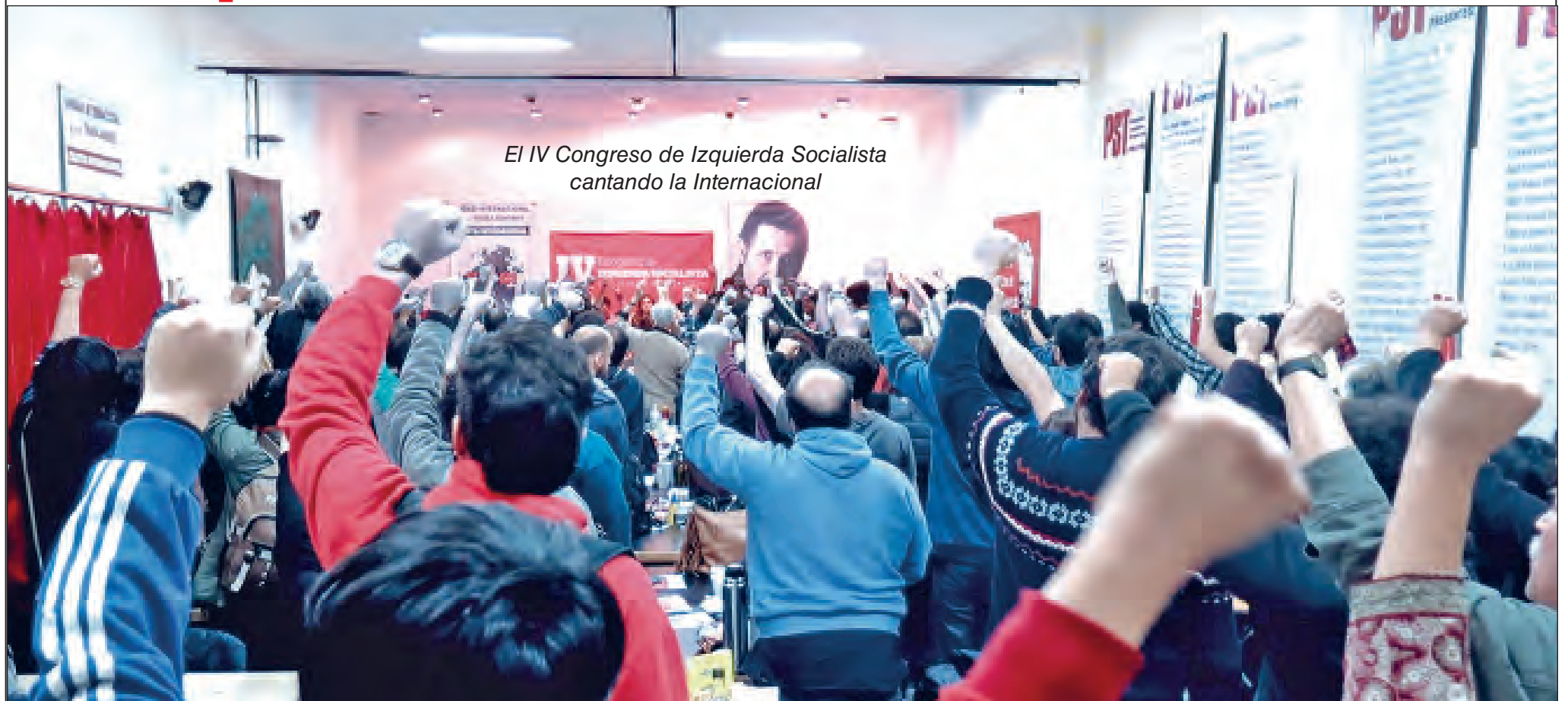
El IV Congreso de Izquierda Socialista cantando la Internacional

Estamos llevando a cabo en todo el país nuestra campaña de recolección de aportes económicos aprovechando el cobro del medio aguinaldo. Sabemos que hacer un aporte en estos momentos significa un gran esfuerzo, ya que está en curso un fuerte ajuste que golpea directamente al bolsillo del pueblo trabajador. La inflación que se come los ingresos populares y el aumento de las tarifas son la mejor muestra de que el gobierno pretende que la crisis la paguemos los de abajo. Ni hablar de que día a día se van sumando cada vez más desocupados para quienes la situación se torna dramática.